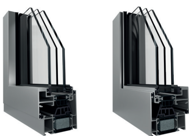
Telaio ad Elle (vista interna ed esterna)