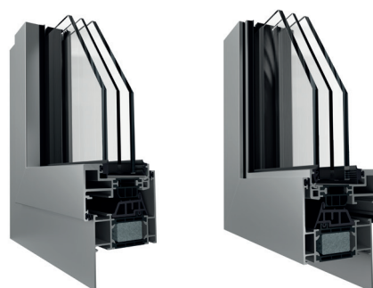
Telaio a Zeta + 35 mm (vista interna ed esterna)