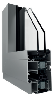
Telaio ad Elle (vista interna ed esterna)