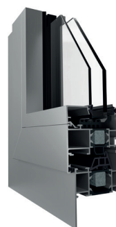
Telaio a Zeta + 35 mm (vista interna ed esterna)