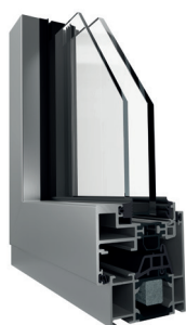
Telaio ad Elle (vista interna ed esterna)