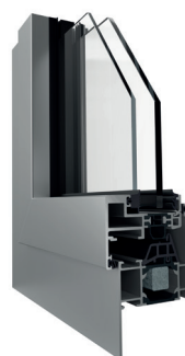
Telaio a Zeta + 35 mm (vista interna ed esterna)